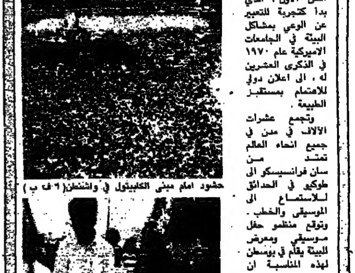
مئود حرس شاركوا في احياء الاحتفال في نيويورك

احتفل الملايين في انحاء العالم بـ يوم الكرة الارضية - لعام ١٩٩٠ في اطار دعوة واسعة النطاق للدفاع عن كوكب الارض الذي تحاصره المخاطر. وتوصل الحدث امس الاول، الذي بدأ كتحية للتعبير عن الوعي بمشاكل البيئة في الجامعات الاميركية عام ١٩٧٠ في الذكرى العشرين له، الى اعلان دولي للاهتمام بمستقبل الطبيعة. وتجمع عشرات الآلاف في مدن في جميع انحاء العالم من تشيكاغو الى سان فرانسيسكو الى طوكيو في المدايق للاستماع الى الموسيقى والغضب. وتوقع منظرو حقل موسيقى ومعرض للبيئة يقام في يومين لهذه المناسبة ان يجذب نحو ٥٠٠٠ شخص الذين هم على ضفة نهر تشارلز، ولكن عدد الحاضرين وصل الى ١٠٠٠٠ شخص. وحضر سياسيون وديبلوماسيون ورجال الاعمال اجتماعاً حاشياً في واشنطن بهدف ان يدعوا على مزيد من التدابير لحماية البيئة.